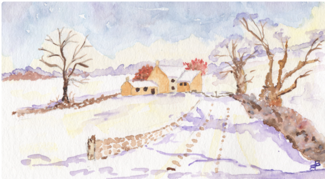
Babette • Paysage de neige, aquarelle, atelier artistique du CAP. Atelier animé par Honorine le lundi à 13 h 30.

Retrouvez plus d'aquarelles sur www.cap-pontdeberaud.fr/atelier-artistique