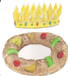
Alain C. • Brioche des rois, aquarelle, atelier artistique du CAP

En Franche-Comté, on trouve une galette plus sèche, consommée souvent à l'apéritif. Dans le sud de la France, on présente une brioche à la fleur d'oranger en forme de couronne, décorée de grains de sucre et de fruits confits avec à l'intérieur à la fois une fève traditionnelle (un haricot sec) et un santon. Près de Nantes, le musée de Blain expose une collection de plus de 10 000 fèves des rois. •