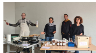
▲ Vente de crêpes et de tickets de tombola par l'école Daudet.