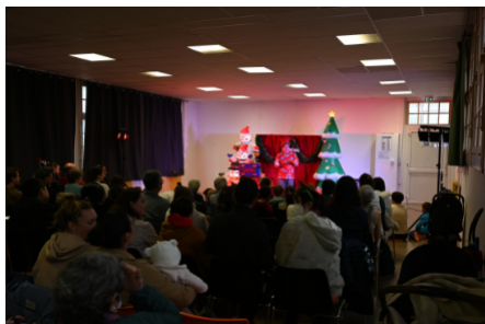
▲ Fabrizio le magicien. ▶

Samedi 9 décembre, grâce à l'école Daudet qui avait relayé l'évènement, parents et enfants étaient nombreux pour applaudir le spectacle de magie proposé par le CAP, suivi de la première représentation de la compagnie Boud'ficelles (jeux de Castelet du CAP). Un goûter de Noël est venu conclure cette belle journée. Une vente de tickets de tombola et de crêpes réalisées par les parents d'élèves de l'école Daudet ont permis de récolter des fonds pour participer au financement de la classe de neige des petits écoliers.