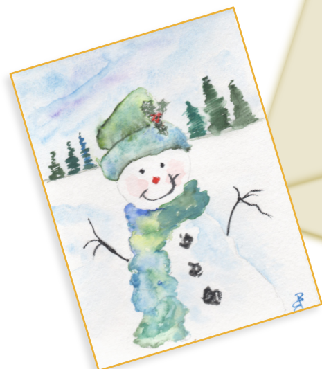
Aquarelles réalisées par l'atelier artistique du CAP. Retrouvez plus de créations sur notre site.